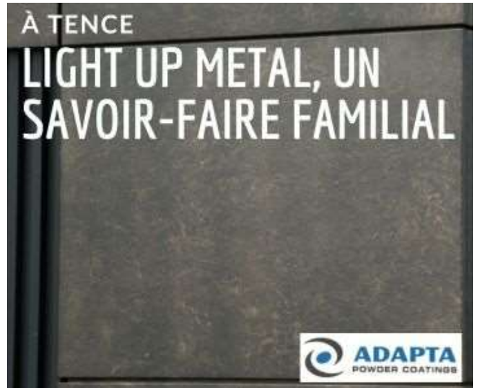
LIGHT UP METAL, un savoir-faire familial