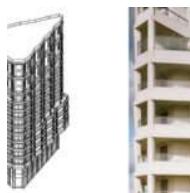
À Bordeaux, un Belvédère de 87 logements signé Lambert Lénack