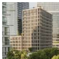
À Paris, Le Berlier aux façades en bois brûlé, signé Moreau Kusunoki