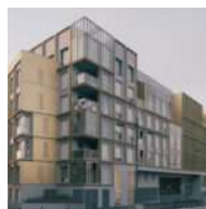
À Gentilly, un ensemble mixte réalisé par ALTA